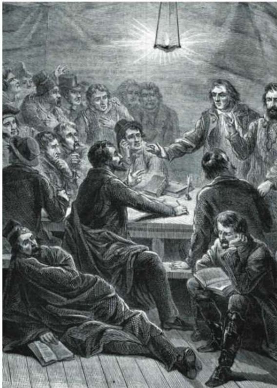
Réunion des Carbonari (Charbonnerie ou Carboneria , début du XIX e siècle). Gravure de 1864.

L'unification italienne autour du Royaume de Piémont-Sardaigne en 1851 conduit les Mazziniens, auxquels se joignent des Républicains d'autres tendances, à poursuivre leur propagande à Marseille. Au début des années 1880, la police associe leurs réunions dans des bars autour de la place d'Aix à de « l'agitation révolutionnaire ». On trouve aussi d'autres types d'exilés italiens, des « sujets