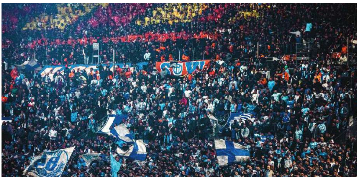
C'est le Oai dans les tribunes du stade.