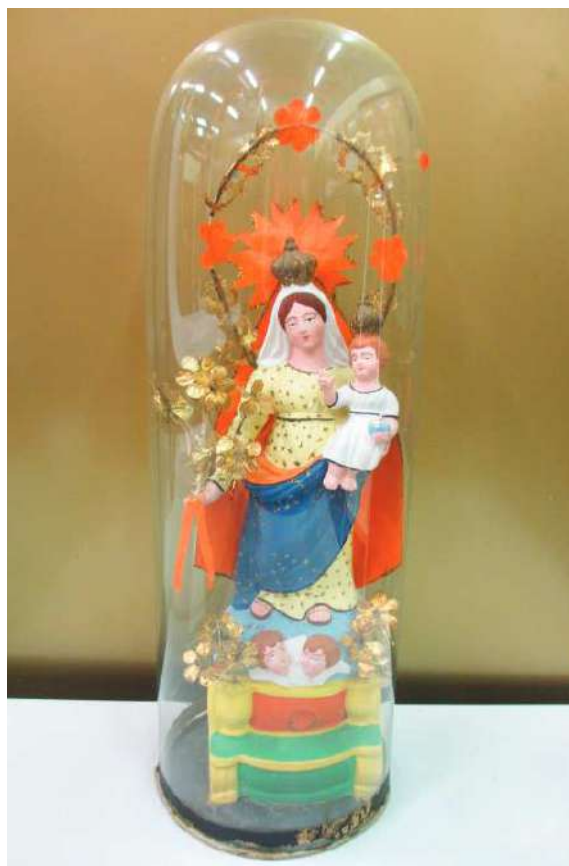
Santibèlli.

Les premiers mots qui refont surface sont péjoratifs : ils renvoient au mépris que les Italiens reçurent lorsqu'ils s'installèrent à Marseille, mépris chargé de xénophobie qui se retrouve dans des appellatifs comme Bâbis , qui désigne des « crapauds » en provençal, ou Nabos , diminutifs