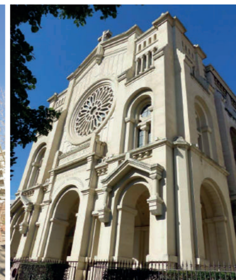
Fig. 2 : Basilique du Sacré Cœur 1920 / 1947