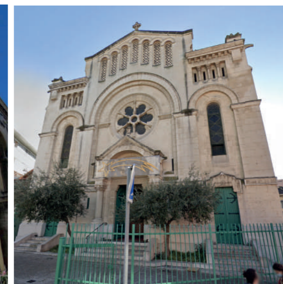
Fig. 3 : Eglise Notre Dame du rouet