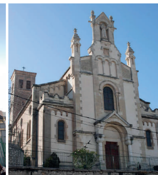
Fig. 4 : Eglise Saint-Antoine de Padoue