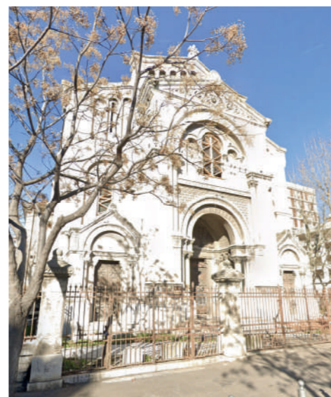
Fig. 1 : Eglise Saint-Martin d'Arenc 1913 / 1924